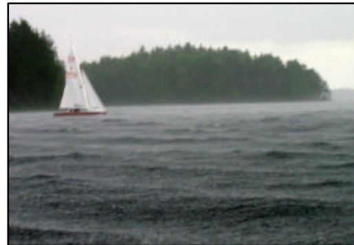
Pahimmassakin kelissä on aina aikaa yhdelle valokuvalle.