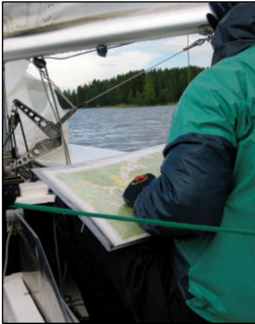
Gamman navigointia sateella.

Ukonsalmen selvitimme vielä kunnialla, mutta seuraavana olleen Sittosalmen (lue Shitosalmi) kohdalla otti olkileipä. Salmessa tuuli loppui täysin ja virtakin sortti. Kõlveet menivät vanhalla vauhdilla ohi kun me yritimme epätoivoisesti luovia salmen läpi. Salmen puolesavälissä huomasimme että Old Lady oli tullut kymmenen metrin päähän. Piinasta selvityämme saimme kuitenkin kasvatettua kaulan noin sataan metriin ennekuin Lehtiset saivat veneensä vauhtiin. Spinnu ylös ja Jänissalmen sekä Matilanselän yli kohti maalia. Old Lady ajoi uskomattoman kovaa spinnun kanssa, mutta onneksi gongi pelasti ja ylitimme maaliiviivan toisena kevytveneenä. Maalissa saimme tietää että Gamma oli pessyt koko porukan ja tullut toisen legin ensimmäisenä veneenä trimaraanin jälkeen maaliin, mahtava suoritus Litiltä.