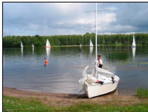
Burgundy ja Old Lady joutuivat lähes täydelliseen pläkään ensimmäisen legin maalissa.

Gammalla vanhana Keitelelen kiertäjänä tosin otti heti lähdössä pienen kaulan eikä Old Ladyäkään Lehtisten veljesten ajamana saatu takana kovin kauaa pidettyä. Aikamme Ääneselkää heikossa tuulessa luovittuamme olimme jo päästäneet pari vintikkaakin ohi joten päätimme oikaista Old Lady'n perässä Talassaarten ”väärältä puolelta” , tokihan ”paikalliset” tietävät mistä mahtuu menemään. Juuri saaret ohitettuamme rupesikin Old Ladyssä köli kolisemaan ja pojat ystävällisesti viittoilivat suosituksena noin 90 asteen kurssimuutosta. Jossain vaiheessa huomasimme ohittaneemme Old Lady'n ja kun tulimme Keitelelen kanavan suulle tuuli hiipui täysin. Loppu lillimisen aikana pääsimme muutamista köliveneistä ja yhdestä vintikasta ohi ja olimme maalissa Gamman ja Windmillin jälkeen kolmantena kevytveneinä.