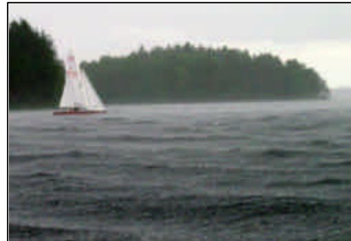
Pahimmassakin kelissä on aina aikaa yhdelle valokuvalle.