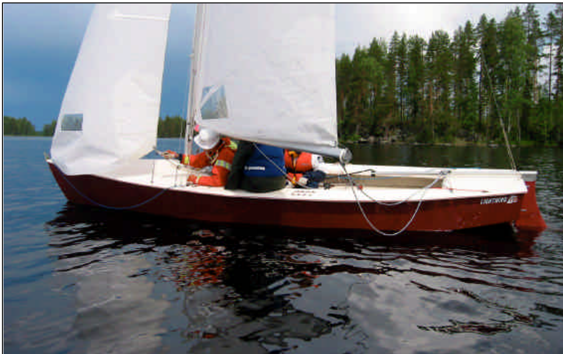
Tyyntä ennen myrskyä. Taustalla nousemassa reipas ukkoskeli.