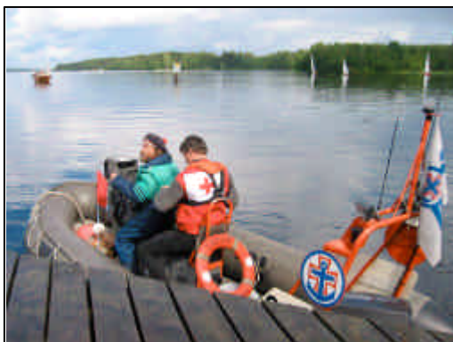
Saattoveneet olivat mukana koko kisan ajan.

Aamulla heti herättyä aloimme kokoamaan venettä ja paikalle saapui kolmanneksi miehistön jäseneksi vaimoni, jonka olin onnistunut ylipuhumaan elämänsä ensimmäiselle purjehdusreissulle Tuusulanjärven ulkopuolelle. Veneen kasattuamme heitimme makuupussit ja kassit huoltoaluksen kannelle ja vesille.