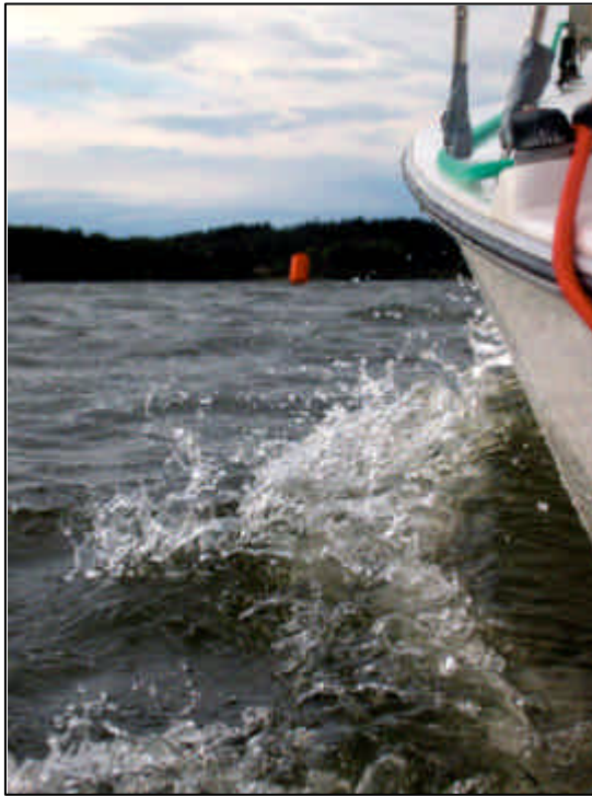
Gamma lähestyy hyvällä vauhdilla alamerkkiä. Syyskisat Tuusulassa.