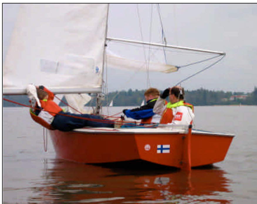
Red Snapper Tuusulan keveissä On The Rocks keleissä.