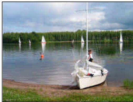
Burgundy ja Old Lady joutuivat lähes täydelliseen pläkään ensimmäisen legin maalissa.

Gammalla vanhana Keiteleen kiertäjänä tosin otti heti lähdössä pienen kaulan eikä Old Ladyäkään Lehtisten veljesten ajamana saatu takana kovin kauaa pidettyä. Aikamme Ääneselkää heikossa tuulessa luovittuamme olimme jo päästäneet pari vintikkaakin ohjioten päätimme oikaista Old Ladyn perässä Talassaarten ”väärältä puolelta” , tokihan ”paikalliset” tietävät mistä mahtuu menemään. Juuri saaret ohitettuamme rupesikin Old Ladynsä köli kolisemaan ja pojat ystävällisesti viittoilivat suosituksena noin 90 asteen kurssimuutosta. Jossain vaiheessa huomasimme ohittaneemme Old Ladyn ja kun tulimme Keiteleen kanavan suulle tuuli hiipui täysin. Loppu lillimisen aikana pääsimme muutamista köliveneistä ja yhdestä vintikasta ohjioten olimme maalissa Gamman ja Windmillin jälkeen kolmantena kevytveneinä.