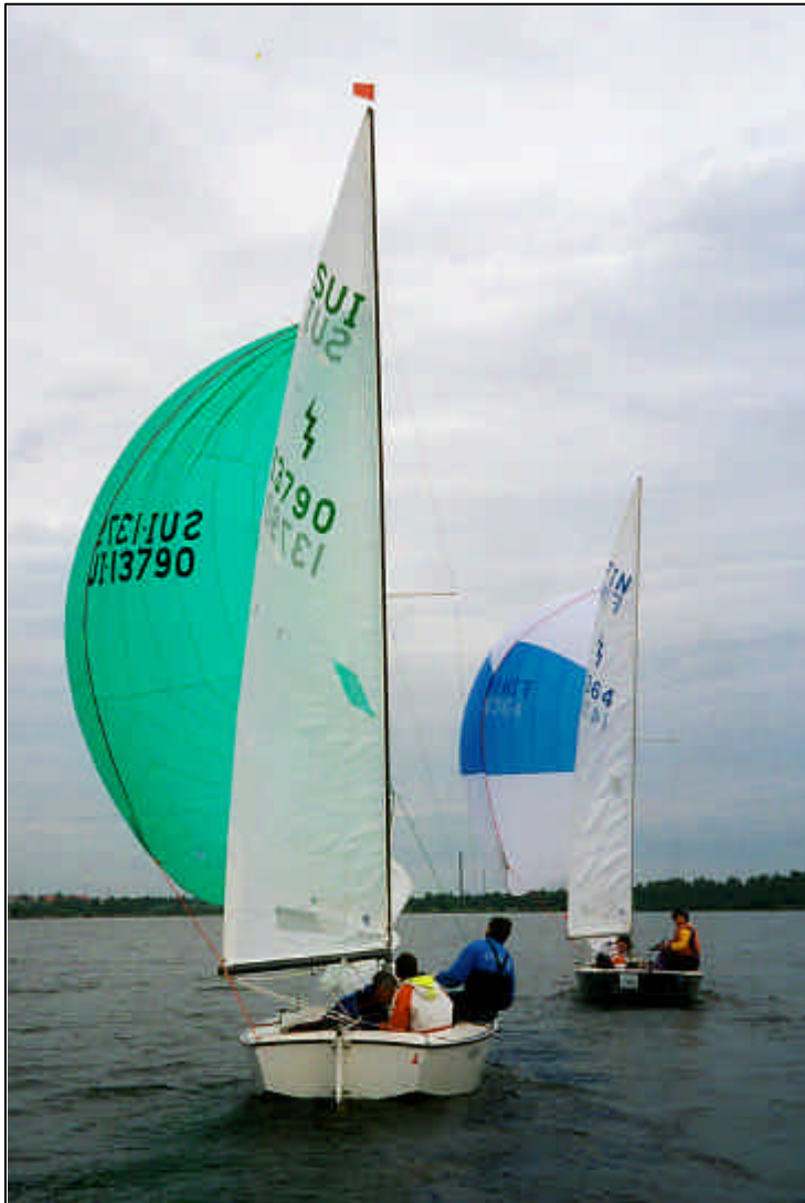
Hallitseva Euroopanmestari Sveitsistä yrittää pysyä Nikean vauhdissa