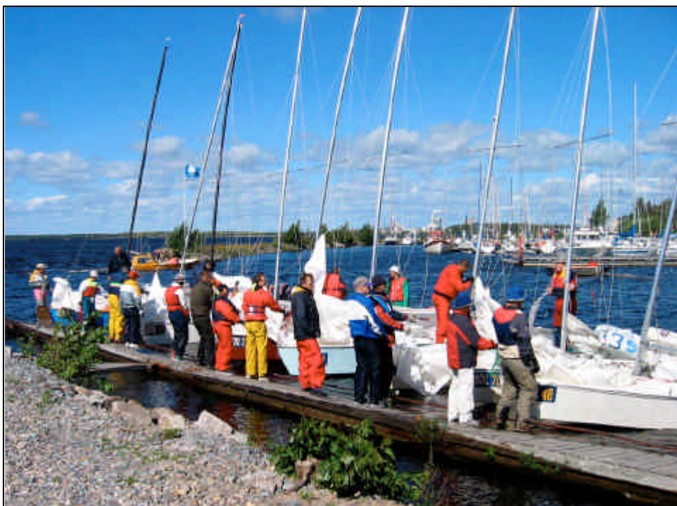
Kauden 2002 gasti on saatu taas järjestykseen...Kuva Kemin EM/SM kisoista.