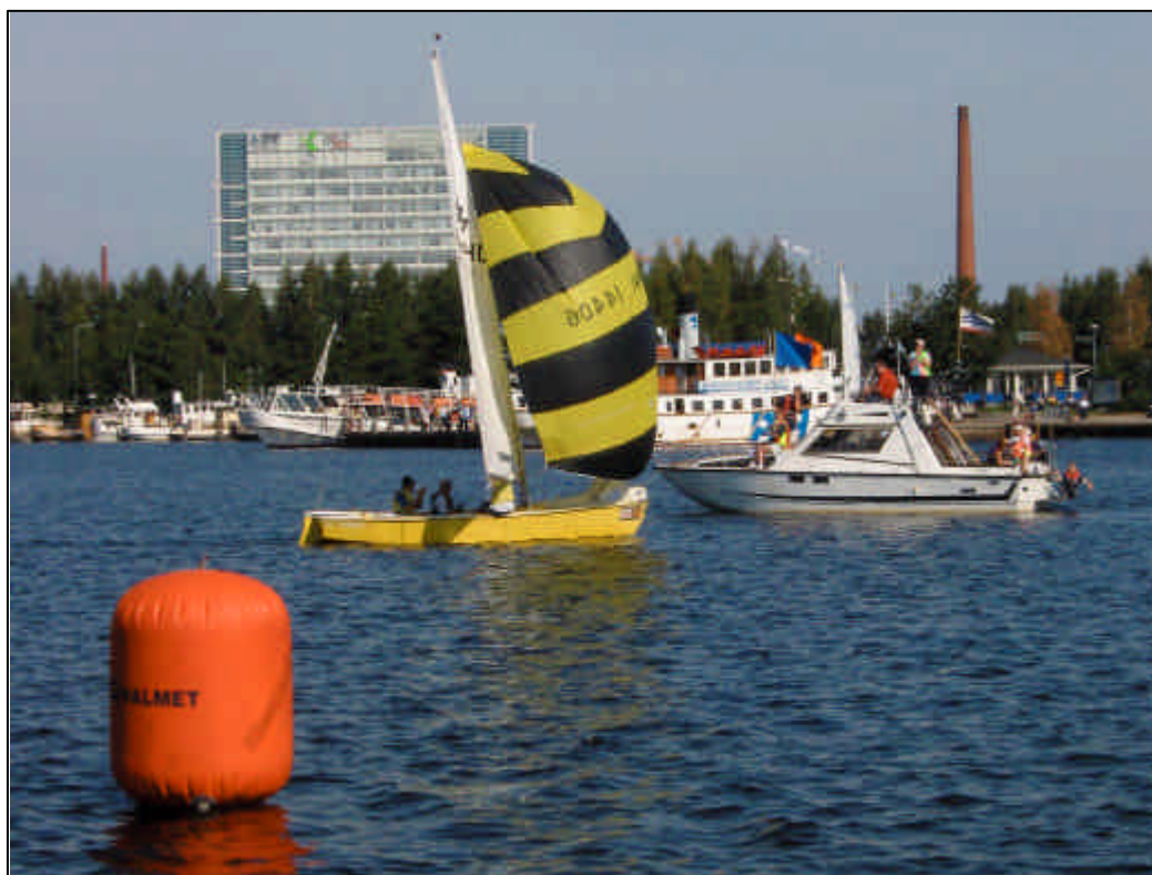
Amarillo ylittämässä maalilinjaa Jyväskylässä.