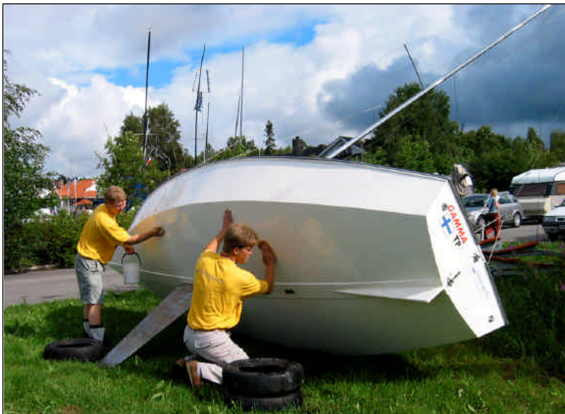
Gamma ottamassa vahakylpyä Kemissä. Huomaa spinnun nostin ja yläkaija joilla vene on kiinni trailerissa eikä suinkaan kölin varassa joka on vain avattu 'varmistukseksi'.

Lightningliitto www.suomenlightningliitto.fi Purjehtijaliitto www.purjehtija.fi