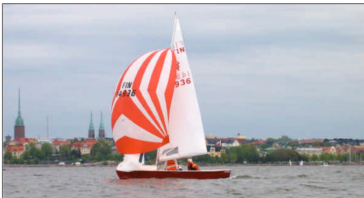
Burgundy Helsingin rankingosakilpailussa.