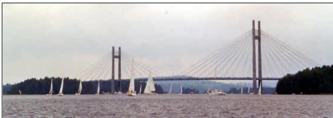
Kärkisten silta pohjoisesta saavuttaessa. Kuvassa näkyvä kölivenne ilman seilejä oli ajanut kivelle hetkeä aikaisemmin, yrittivät oikaista...