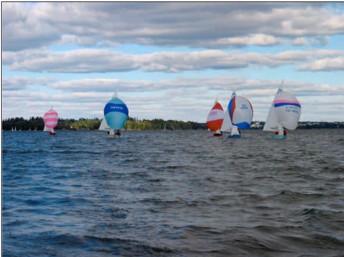
Syksyn viimeiset Litikisat Tuusulassa. Kelit todella suosivat purjehtijoita.