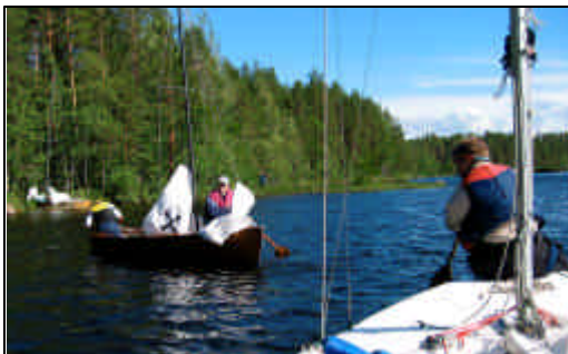
Kevytveneet parkkiin rantaruovikkoon

Matilavirralla oli veneitten parkkeeraustila hieman kortilla joten kevytveneet yövyttiin mikä missäkin puskassa mitä mielenkiintoisemmilla systeemeillä. No perillä kuitenkin odottivat hernesoppa ja sauna sekä tanssit paikallisessa ravintolassa.